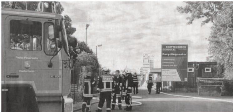
Rasch hatte die Feuerwehr die Flammen auf dem Mombacher Lager- und Sortierplatz für Sperrmüll im Griff.

Gegen 20.30 Uhr hatten die Brandbekämpfer das Feuer be-