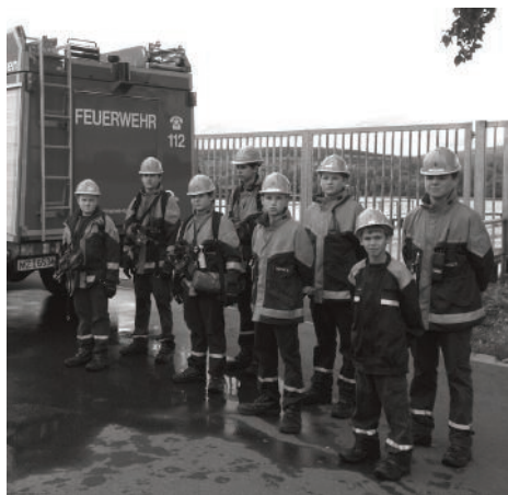
Übung in der »Gruppe«, nach der FwDV4, antreten zu acht hinter dem Fahrzeug.

Das Jahr 2011 ist nun so gut wie beendet und die Ausbilder überlegen sich schon wieder viele tolle und interessante Veranstaltungen und Ausflüge für die Wintersaison. Aber auch schon