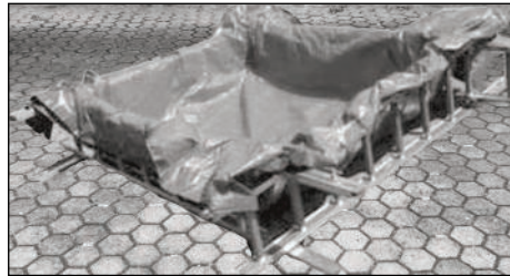
4 Steckleiterteile bilden den Grundrahmen für ein provisorisches Auffangbecken.

eine Rettungshöhe bis zum 2. Stock zugelassen. Verladen ist sie von 4,6 m lang und 50 kg schwer, zusammengesteckt bringt sie es auf 8,4 m. Sie ist