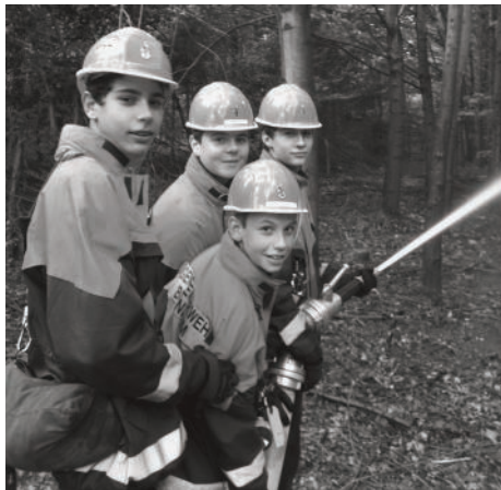
Hier heißt es »Wasser marsch!«

für das kommende Jahr 2012, in dem ein Schwimmbadbesuch, Besichtigung einer Berufsfeuerwehr bzw. das Technische Hilfswerks geplant ist und vielleicht sogar ein Zeltlagerwochenende sein wird. Vielleicht wird das eine oder andere noch dazukommen.