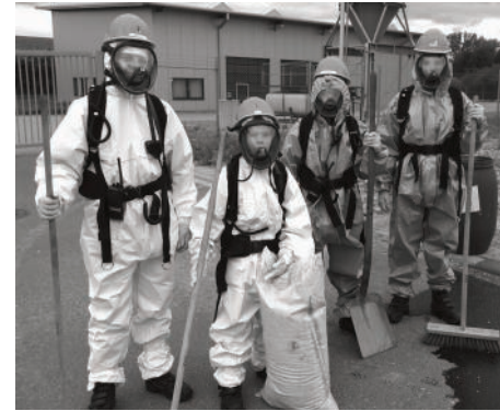
Nachgeieffert - wie die Aktive Wehr, so übt auch die Jugendfeuerwehr einen möglichen Gefahrguteinsatz im Schutzanzug.

begann mit der Aufteilung auf die Fahrzeuge, für die Einsatzbereitschaft, im Falle eines „Einsatzes.“ Nun wurde die Gerätepflege durchgeführt, dazu gehörte die Pflege der Fahrzeuge, die Schlauchwäsche und das Prüfen der Fahrzeuge auf Vollständigkeit. Das erste Alarmstichwort hieß Brandmeldealarm, der sich als ein Fehlalarm herausstellte. Nach der Ankunft im Gerätehaus wurde der Dienst mit Knotenkunde und Dienstsport aufgenommen. Im Laufe des Tages wurde eine Gefahrgutübung durchgeführt. Weitere „Einsätze“ an diesem Tag waren ein Gefahrgutunfall, eine Personensuche am Rhein, ein Flächenbrand und zum Abschluss ein Wohnungsbrand, bei dem die neuen Atemschutzgeräte super eingesetzt werden konnten. Am Ende des Tages waren alle superhappy und waren stolz darauf ein „Jugendfeuerwehrberufsfeuerwehrmann“, zumindest für diesen Tag zu sein.