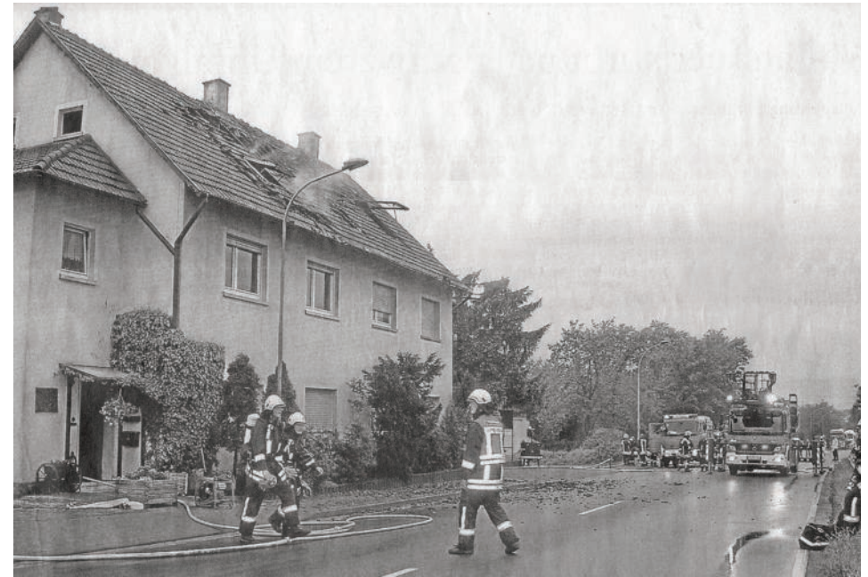
Dachstuhlbrand nach Blitzeinschlag in der Mainzer Landstraße - FF-Budenheim im Einsatz.

heblich und jeder Einsatzleiter trägt die Verantwortung, dass genügend Personal (qualifiziert als Atemschutzgeräteträger) verfügbar ist. Am 27.04. um 16:07 Uhr erreichte, von Mainz her kommend ein schweres Unwetter Budenheim, mit Starkregen, Blitz und Donner. Ich war im Ort unterwegs, sah und hörte einen gewaltigen Blitz herniederfahren. Nichts Ungewöhnliches, es gibt ja Blitzschutzeinrichtungen. Doch kurz darauf der Meldereingang: „Gebäudebrand Mainzer Landstraße 145“. Eine Fahrt mit dem Einsatzleitwagen durch eine Regenwand mit Sichtweite von ca. 5 m. Bei der Ankunft an der Einsatzstelle schlugen die Flammen aus dem Dach, wie sich herausstellte von einem Blitzschlag verursacht. Personen befinden